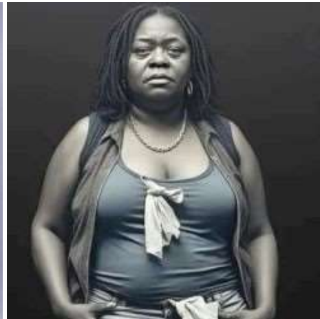
Ho 35 anni e vendo frutta. Mi hanno offerto di fare la puttana, ma voglio essere io a dirigere, non chi paga.