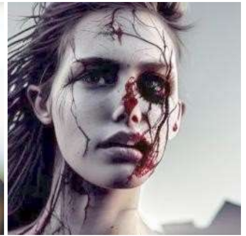
L'acido mi ha tolto tutto. Ho 24 anni e gli uomini hanno per me solo pietà o disgusto. Voglio fare sesso.