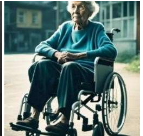
Ho 73 anni e sono vedova da 30 anni. Voglio fare sesso prima di morire.

Dopo un week end di addestramento e precisazioni sulle regole della Villa, le Volontarie sono state inserite nei diversi progetti.