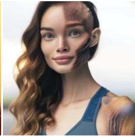
Chi mi guarda si spaventa. Ho 30 anni e faccio la lavapiatti. Non frequento nessuno, ma ho bisogno di sesso.