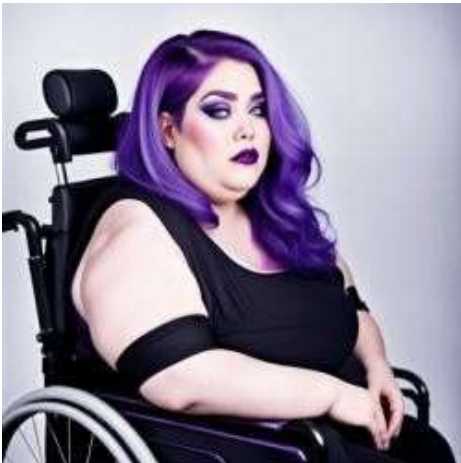
Ero bella tre anni fa. Un incidente mi ha tolto le gambe. Voglio fare sesso senza che un uomo mi guardi.